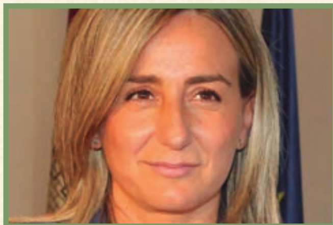
MILAGROS TOLÓN Alcaldesa de Toledo y Vicepresidenta 2ª de la FEMP

“Sin el despliegue de la economía circular no será posible alcanzar los objetivos de descarbonización que en la Unión Europea y a nivel global, en el marco del acuerdo de París, nos hemos planteado. El reto es importante, pero para ello contamos con herramientas, normativas y financiación ”