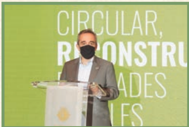
ISMAEL AZNAR Director General de Calidad y Evaluación Ambiental del MITERD

“Sin el despliegue de la economía circular no será posible alcanzar los objetivos de descarbonización que en la Unión Europea y a nivel global, en el marco del acuerdo de París, nos hemos planteado. El reto es importante, pero para ello contamos con herramientas, normativas y financiación ”