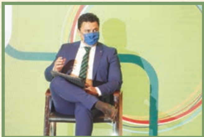
JOSÉ MIGUEL LUENGO Alcalde de San Javier y Presidente de la Comisión de Medio Ambiente de la FEMP

“ Tenemos una responsabilidad en la formación y educación de la ciudadanía para que entienda muy bien y asimile y aplique los hábitos de consumo que requiere la economía circular. Por eso, las campañas de sensibilización están presentes en el día a día de la gestión del Ayuntamiento”